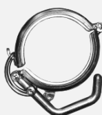
DFS Disaflow Klamra łącząca