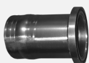
DFS Disaflow Końcówka węża